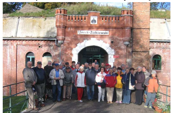
Przed wejściem do Fortu IV