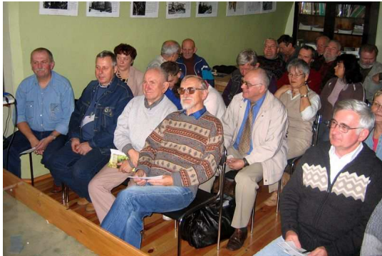
Na sali obrad