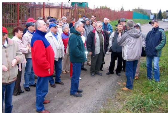
Na wycieczce po toruńskich umocnieniach